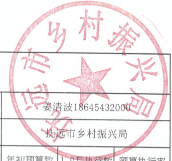
绩效运行监控表 (2022年度)